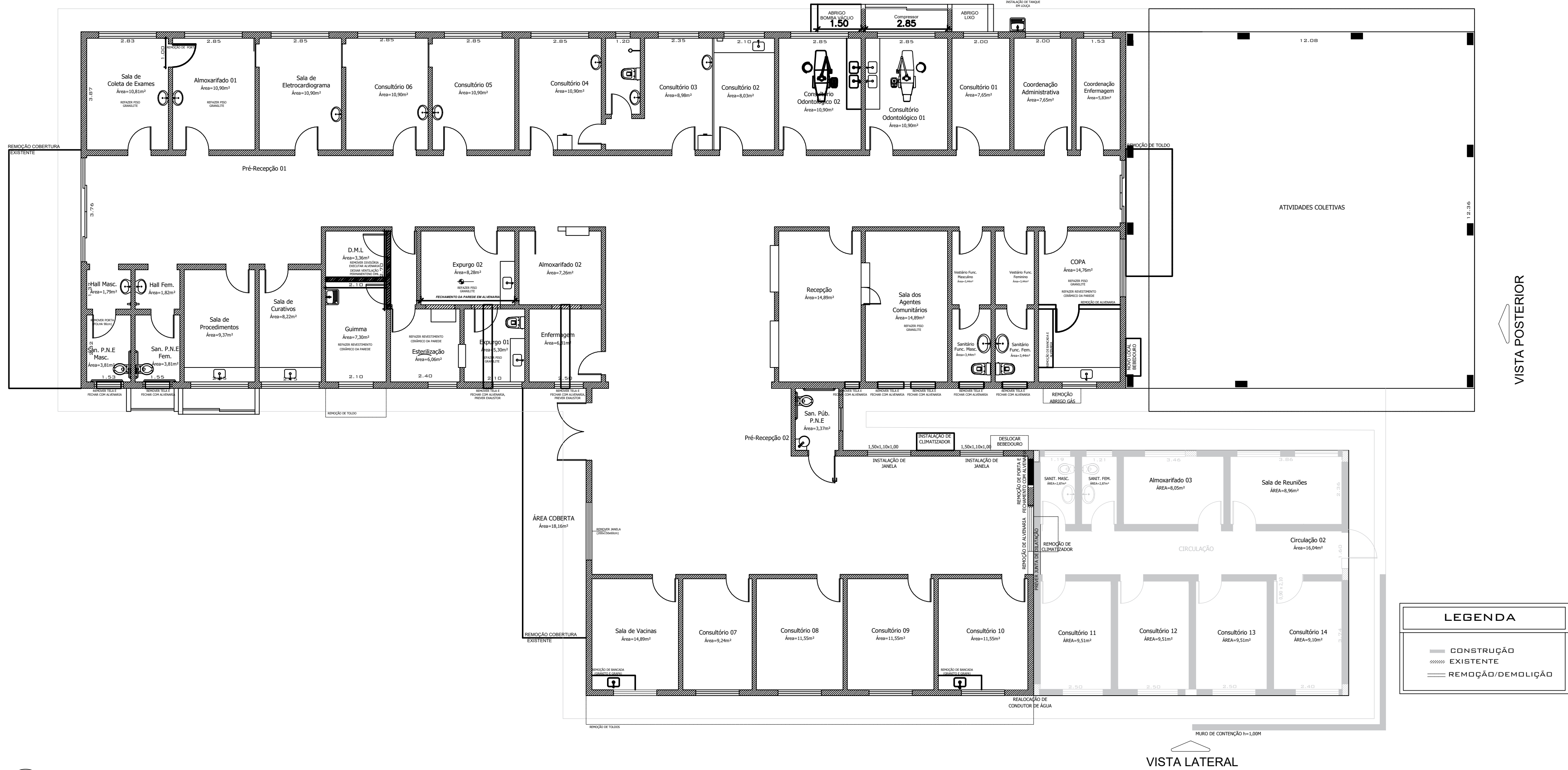
1 PLANTA BAIXA - REMOÇÃO/DEMOLIÇÃO ESCALA 1/100