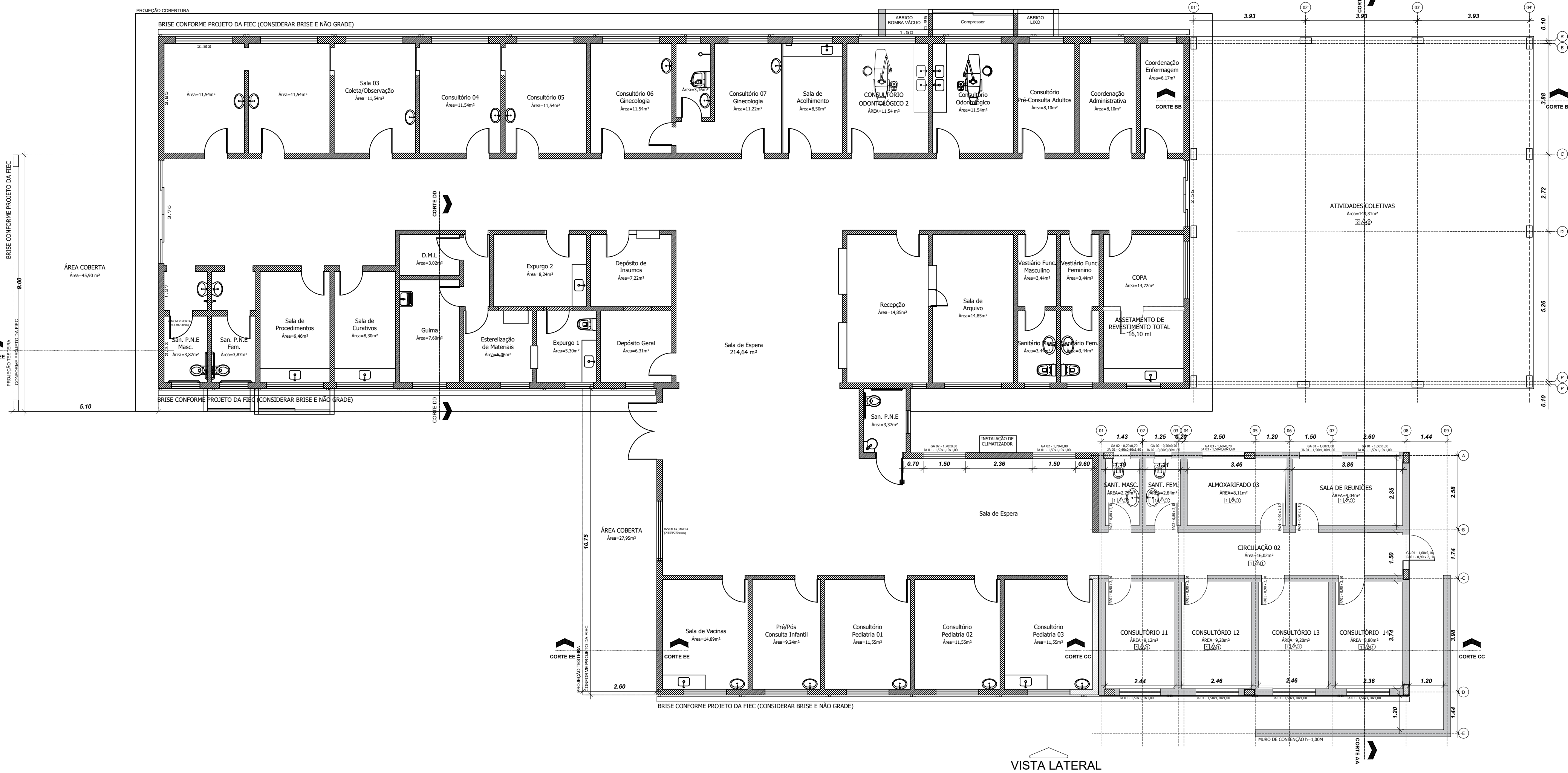
2 PLANTA BAIXA - AMPLIAÇÃO/ADEQUAÇÃO ESCALA 1/100